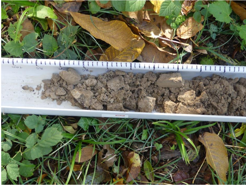
Figure 3 : exemple d'horizon rédoxique, témoignant d'un engorgement temporaire du sol en eau