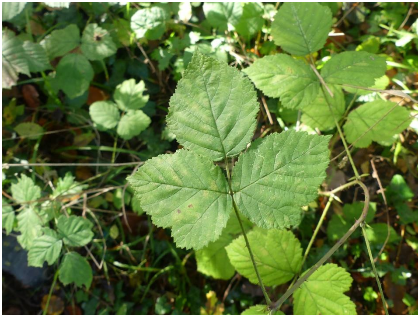
Figure 4 : Ronce bleue (Rubus caesius), présente sur la liste des espèces hydromorphes, et présente sur le site