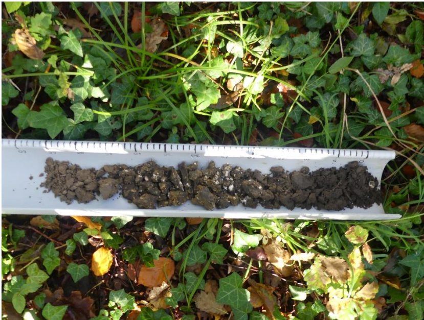
Figure 1 : absence de traits d'hydromorphie dans les premiers centimètres du sol, avec apparition de matériaux exogènes dès 15 cm