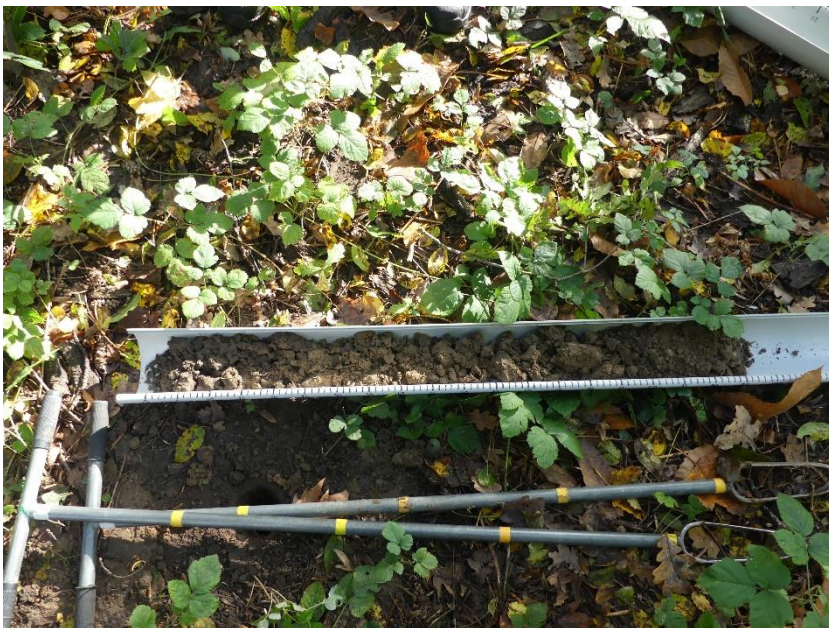
Figure 2 : brunisol peu perturbé, profond