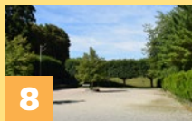
Terrains de Pétanque Rue de l'Île Saint-Pierre