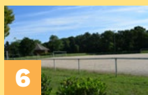
Stade des Foucherolles Rue des Foucherolles