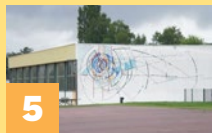
Stade Langenargen Rue Moreau de Tours