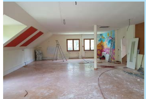
Chantier mise aux normes bâtiment socioculturel Cély