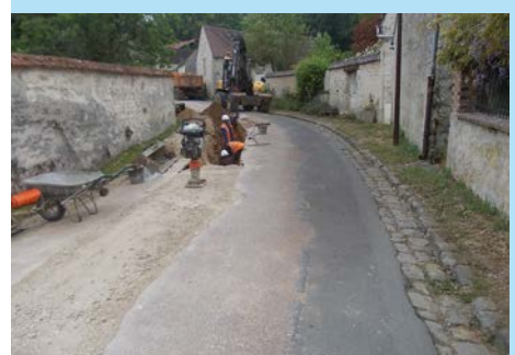
Travaux eau potable à Boissy aux Cailles