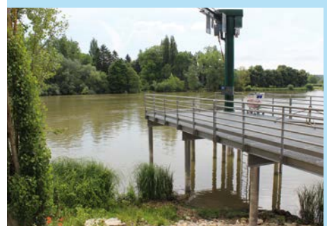
Chantier Port de Valvins à Avon