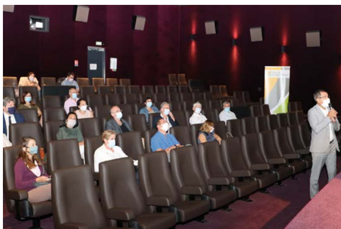
Séminaire animé par l'AMF

Chacun de ces équipements accueille un nombre considérable d'utilisateurs et de visiteurs ; les associations, les écoles, mais aussi les organisateurs d'événements. Certains de ces équipements concourent à devenir Centre de Préparation aux Jeux dans le cadre des JO 2024. L'agglomération et une partie de ses communes sont d'ores et déjà labellisées Terre de Jeux.