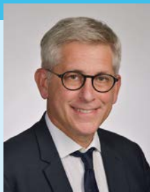
Frédéric VALLETOUX Maire de Fontainebleau Attractivité, tourisme, enseignement supérieur