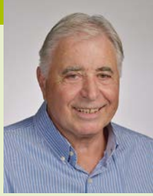
Patrice MALCHÈRE Maire d'Achères-la-forêt