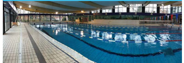
Piscine de la Faisanderie