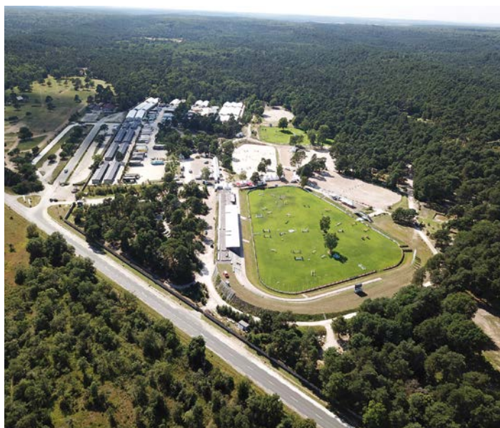
Le Grand Parquet