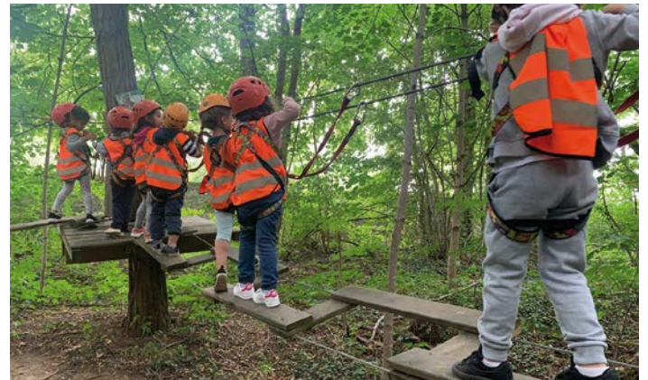
Activités été 2020

Les mercredis sur le thème de « Il était une fois la vie, de la préhistoire à nos jours » permettent d'accueillir 76 enfants de 3 à 11 ans. Les activités et sorties de la première période s'articuleront autour de la découverte des dinosaures et de la préhistoire. L'équipe d'animation propose des activités sportives, de plein air et des grands jeux en extérieur, dans le respect des protocoles sanitaires. ■