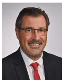
Pascal GOUHOURY Président du Pays de Fontainebleau Maire de Samoreau

La communauté d'agglomération du Pays de Fontainebleau, née il y a 3 ans, compte 26 communes. Autour de la table, les élus ont pour dessein commun, celui de positionner l'intercommunalité comme levier pour le service aux habitants et les grands projets à l'échelle du territoire.