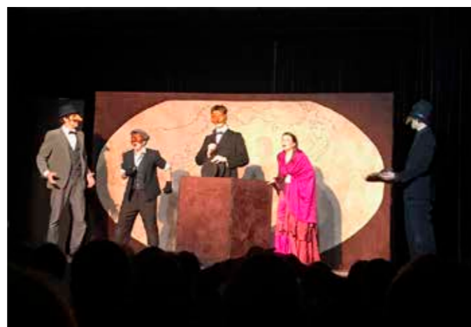
Les élèves de l'école Olivier Métra ont pu bénéficier, quant à eux, d'une projection qui leur était spécialement dédiée. Ils ont ainsi pu assister à une représentation de la pièce « Le tour du monde en 80 jours ».

porté son appellation de « spectacle vivant » puisque la pièce programmée la première soirée, « Glandeurs nature », a été remplacée à la dernière minute. La vingtaine de bénévoles des Briardises a mis toute son énergie pour trouver une solution en quelques heures. Finalement, l'équipe de « Faites l'amour avec un Belge » est arrivée à la toute dernière minute, dans une salle patiente et bienveillante. Un quiproquo digne d'une véritable pièce de théâtre que les spectateurs, patients et sympathiques, ont apprécié et applaudi.