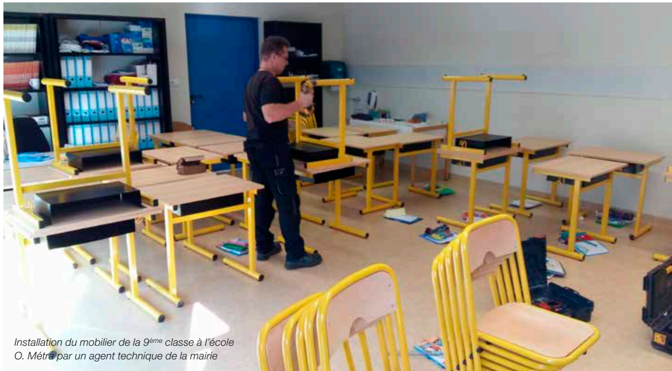
Installation du mobilier de la 9 ème classe à l'école O. Métra par un agent technique de la mairie