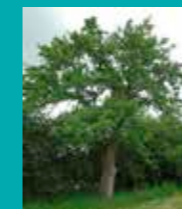
Exemple de Cormier adulte