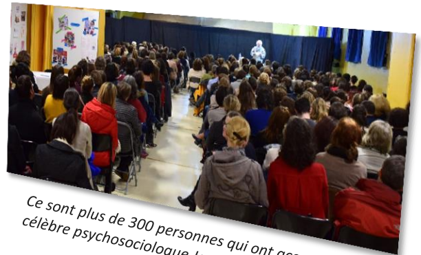
Ce sont plus de 300 personnes qui ont accueilli le célèbre psychosociologue Jean Epstein.