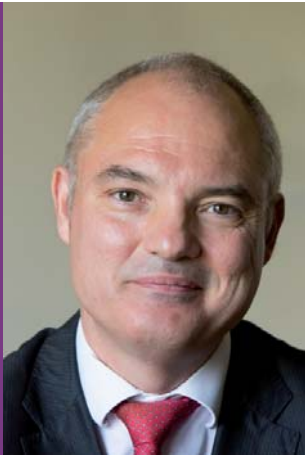
Jérôme Mabile , Maire de Bois-Le-Roi