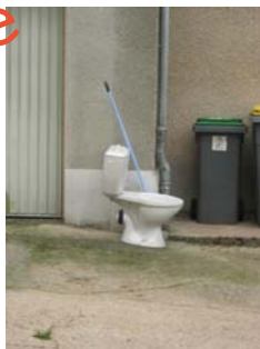
Photo insolite et clin d'œil de Justine Arnou pour finir l'année 2008, proclamée par l'ONU «l'année des toilettes pour sauver des vies».

20 mars 2008 sur AFP. + d'info sur google tape année des toilettes